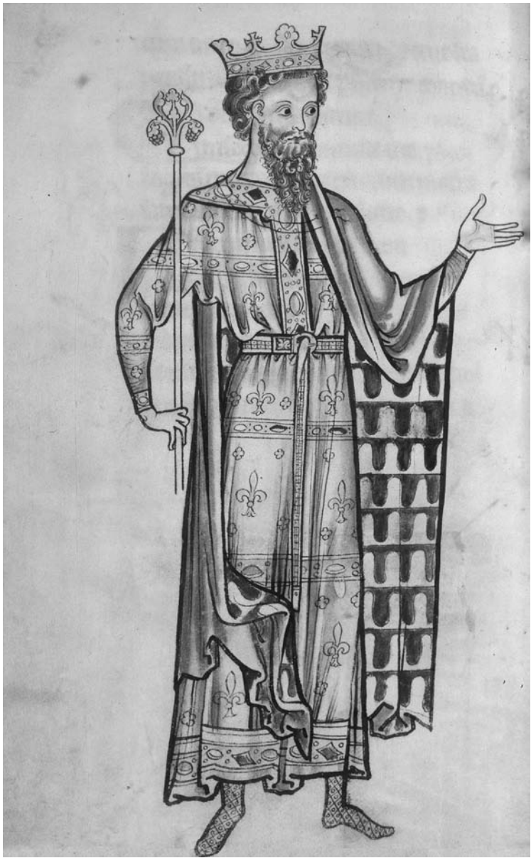
Edward »der Bekenner«