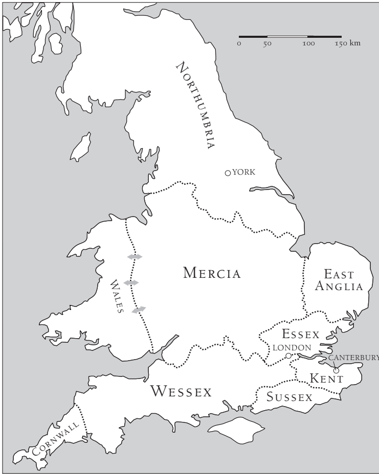
England im 8. Jahrhundert: »Heptarchie«. Die hier eingezeichneten Grenzen sollen nur eine etwaige Vorstellung geben. In Wahrheit verschoben sie sich ständig.

umgehend einen Mönch namens Augustin ins ferne Britannien, der dort 597 ankam. Augustin hatte das große Glück, dass er in Kent landete, denn es war das weltoffenste der sieben Königreiche, unterhielt aufgrund seiner Geografie engeren Kontakt zum Kontinent als seine Nachbarn, und die kentische Köni-