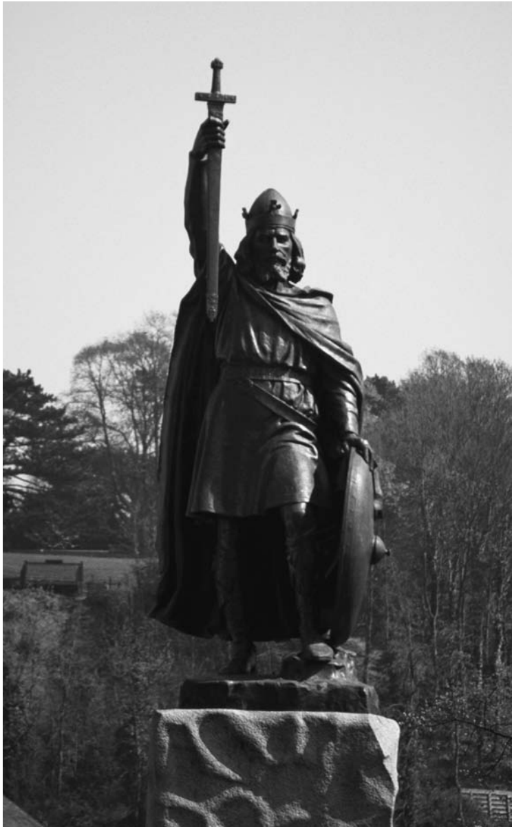
Unvergessen: Statue Alfreds des Großen in Winchester