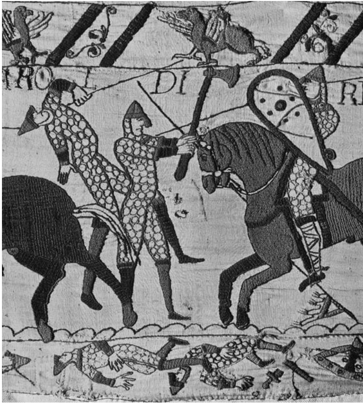
Schlacht von Hastings im Teppich von Bayeux

behauptet wird, sondern von den Normannen niedergedrückt und anschließend in viele kleine Stücke zerhackt), und als die Sonne unterging, hatte William gesiegt und einen neuen Beinamen: Aus dem Bastard war »der Eroberer« geworden.